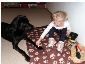
„Ich nehme Kontakt auf“

Das Anliegen bei dem Einsatz des Hundes ist es, den Kindern eine weitere Erfahrungswelt zu bieten, die es ihnen ermöglicht auf ihre Stärken, Fähigkeiten, Kompetenzen und Gaben zuzugreifen, diese weiterzuentwickeln und zu wachsen. So unterstützen wir sie, in ihrer Entwicklung der Selbstbestimmung, Selbständigkeit und Selbstbewusstseins.