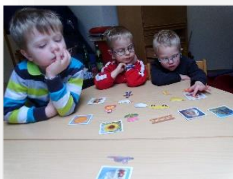
Spracharbeit: „Wir finden Bilder zu Lauten.“