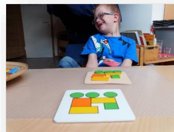
Sensomotorik – Raum-Lage-Wahrnehmung: „Ich lege Fahrzeuge nach“