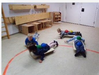
Psychomotorische Kleinstgruppenarbeit: „Wir gehen in Beziehung.“