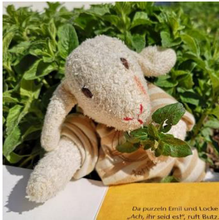
Da purzeln Emil und Locke „Ach, ihr seid es!“, ruft Butz.